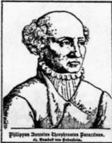
Philippus Aureolus Theophrastus Paracelsus. ex. Beucler von Gabelstein.

Secondo Jung Paracelso non è conscio del grande conflitto che porta in sé. Infatti: "E' proprio alla costellazione degli opposti più potenti che Paracelso deve la sua energia pressochè demoniaca la qua-